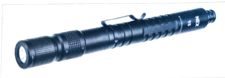
Зображення 4. Інтернет-джерело порівняльного зразку.

бренду «Nextorch» моделі «№18 Walker» виробництва КНР, що відносяться до індивідуальних пристроїв самозахисту (див. зображення 4).