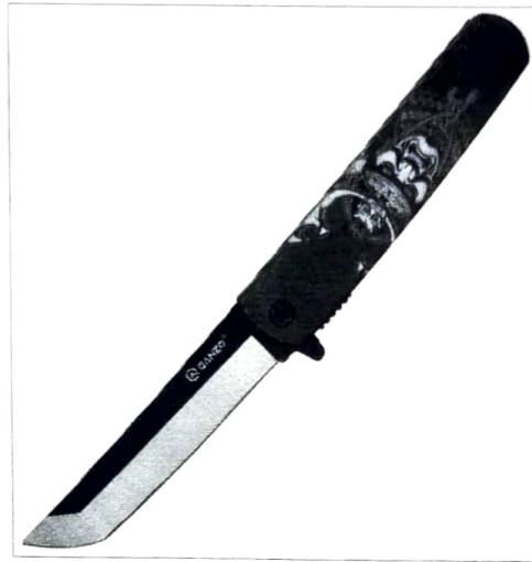
Зображення 5. Інтернет джерело порівняльного зразку наданого ножа: https://ganzo.ua/nozh-g7361-chernyy-zelenyy-khaki/

побутового призначення, наданих в спеціальній криміналістичній, довідковій літературі, відповідних каталогах, офіційних Інтернет-сайтах фірм-виробників та ін., а також з числа інформаційно-довідковій колекції сектору досліджень зброї ВКВД Харківського НДЕКЦ встановлено схожість порівнюваних розмірно-конструкційних характеристик наданого ножа з аналогічними параметричними даними складаних ножів виготовлених промисловим способом, ф. «GANZO», моделі «G626» що мають господарсько-побутове призначення (див. зображення 5).