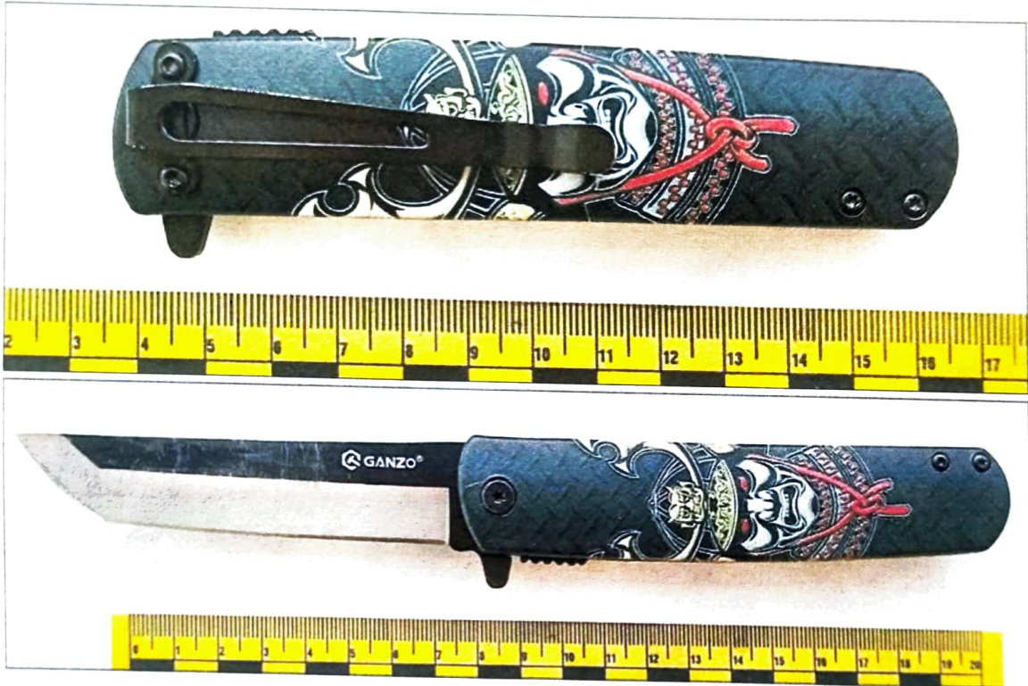
Зображення 1,2. Витягнутий з пакунку об'єкт у складеному та розкладеному стані.

Наданий на дослідження складний ніж складається з клинка, руків'я та механізму виводу клинка (див. зображення 2,3).