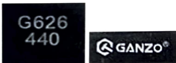
Зображення 4. Маркувальні позначення.

Характер виконання досліджуваного ножа свідчить про промисловий спосіб його виготовлення.